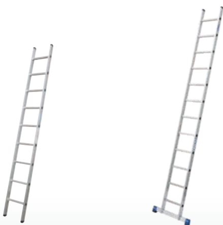
Wersja drabin 6–9 szczable użytkowana bez stabilizatora.