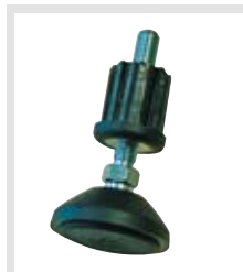
Stopy o regulowanej wysokości dostępne jako akcesoria