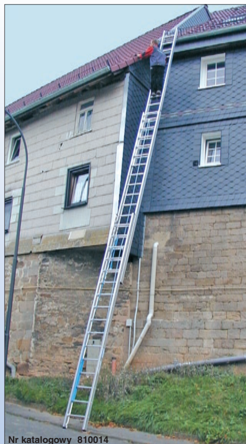
Nr katalogowy 810014